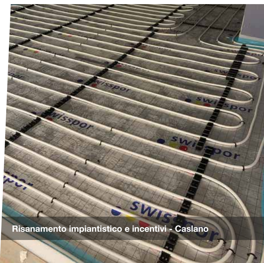
Risanamento impiantistico e incentivi - Caslano