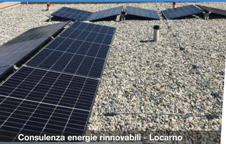
Consulenza energie rinnovabili - Locarno

Consulenza energetica e acustica Fisica dell'edilizia Progettazione RVCS Patologia e diagnostica edilizia Monitoraggio vibrazioni Rilevazioni strumentali