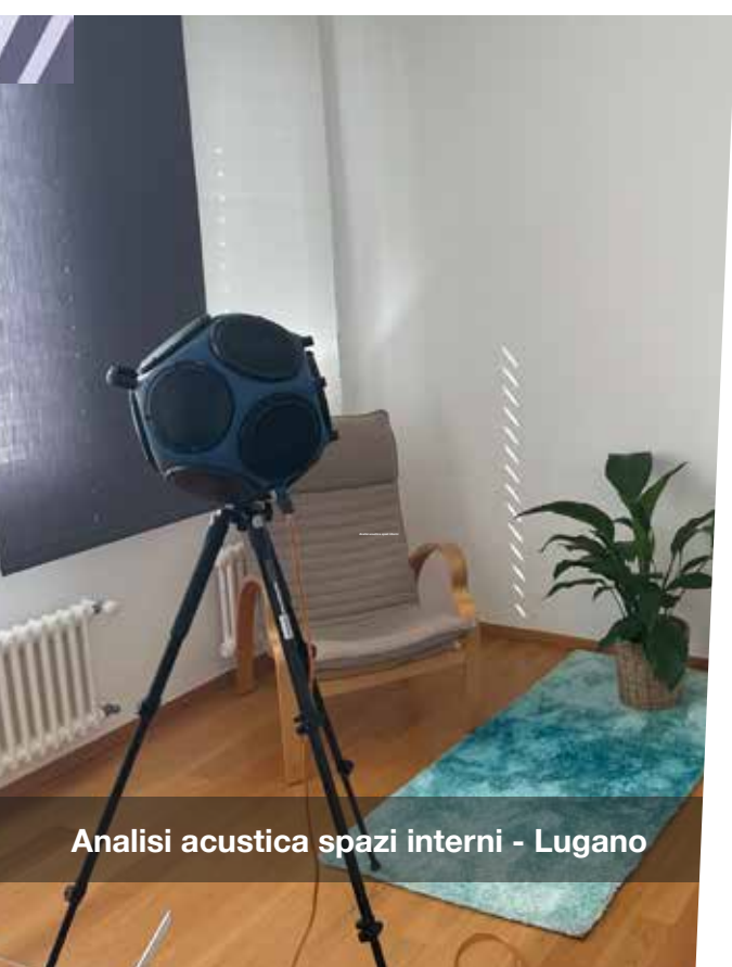
Analisi acustica spazi interni - Lugano