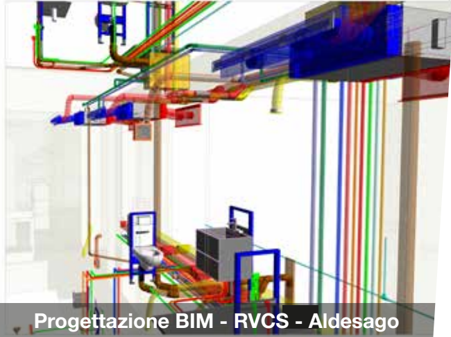
Progettazione BIM - RVCS - Aldesago