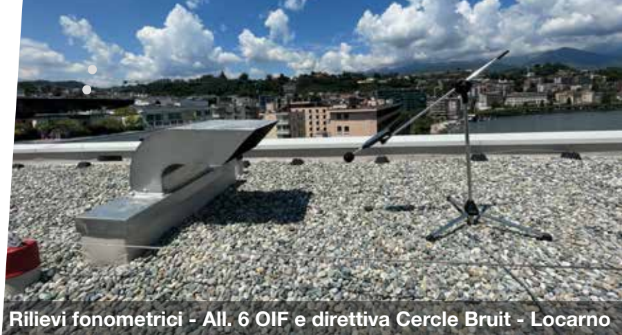
Rilievi fonometrici - All. 6 OIF e direttiva Cercle Bruit - Locarno