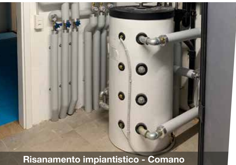
Risanamento impiantistico - Comano