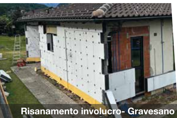
Risanamento involucro - Gravesano