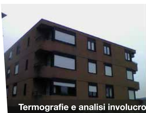
Termografie e analisi involucro - Paradiso