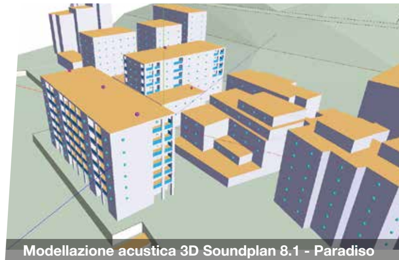
Modellazione acustica 3D Soundplan 8.1 - Paradiso