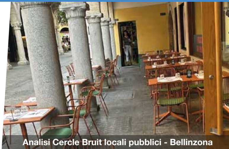
Analisi Cercle Bruit locali pubblici - Bellinzona