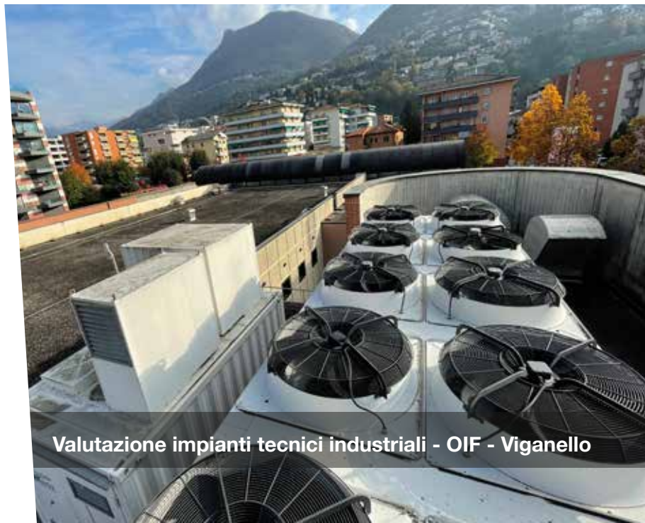
Valutazione impianti tecnici industriali - OIF - Viganello